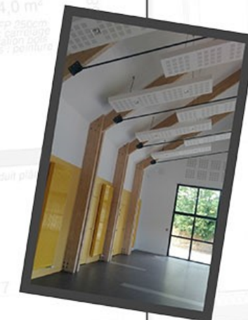
Terrasse 49,5 m 2