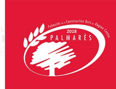
© 1 : Agence Duthilleul et 2 : Charpentes du Gatinais